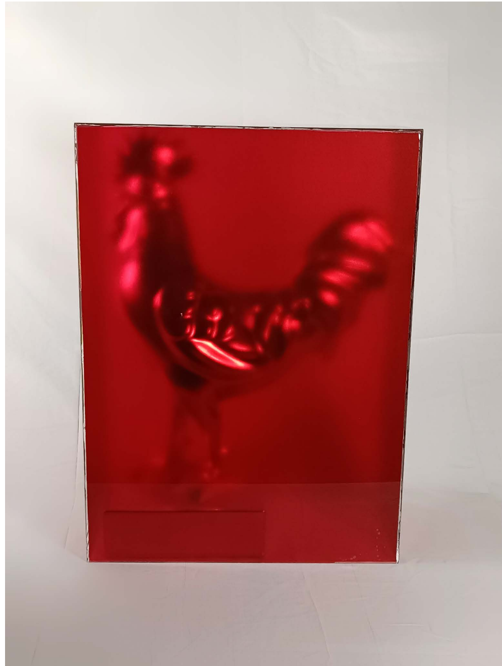
Fiberglass & Plexiglass 52 × 38 × 19 cm Ed 1/3 2024 150/000/000T