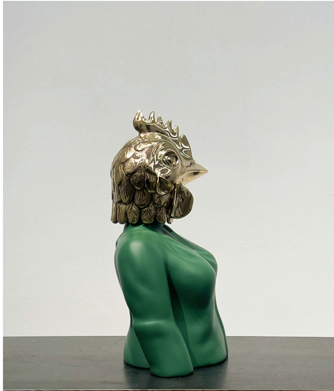
Fiberglass & bronze 25 × 15 × 39 cm Ed 1/3 2024 100/000/000T