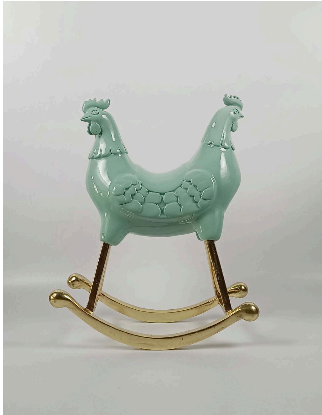
Fiberglass & bronze 25 × 13 × 30 cm Ed 1/3 2024 80/000/000T