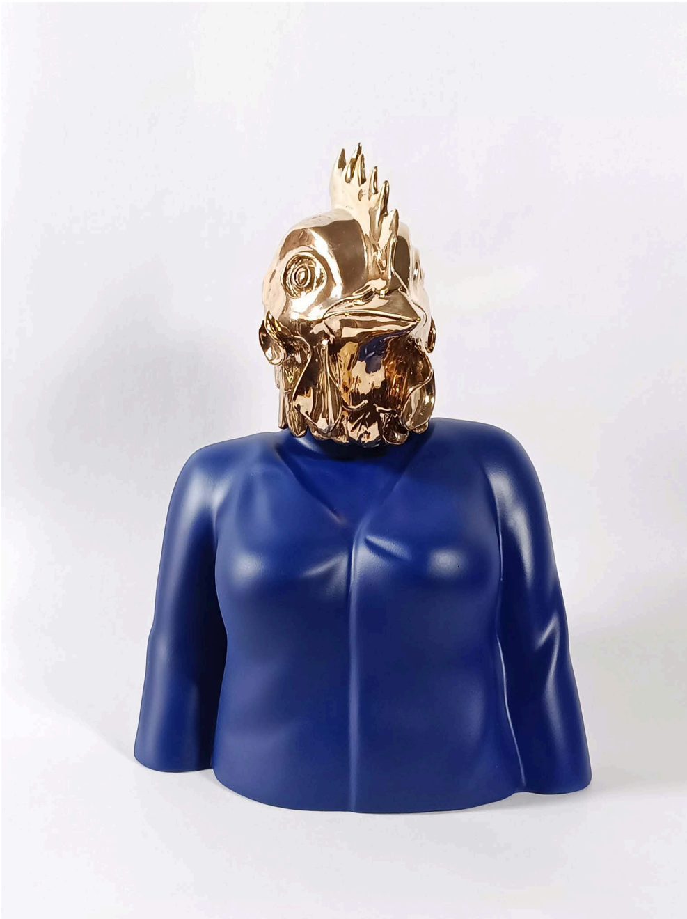
Fiberglass & bronze 25 × 15 × 39 cm Ed 3/5 2024 100/000/000T