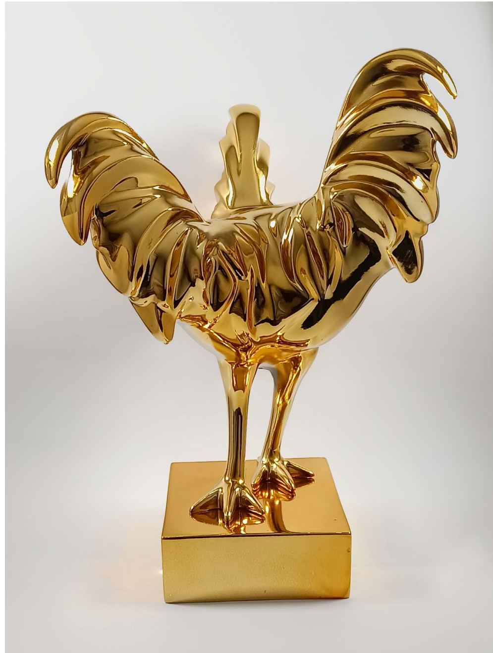
Fiberglass 38 × 38 × 33 cm Ed 1/3 2024 170/000/000T