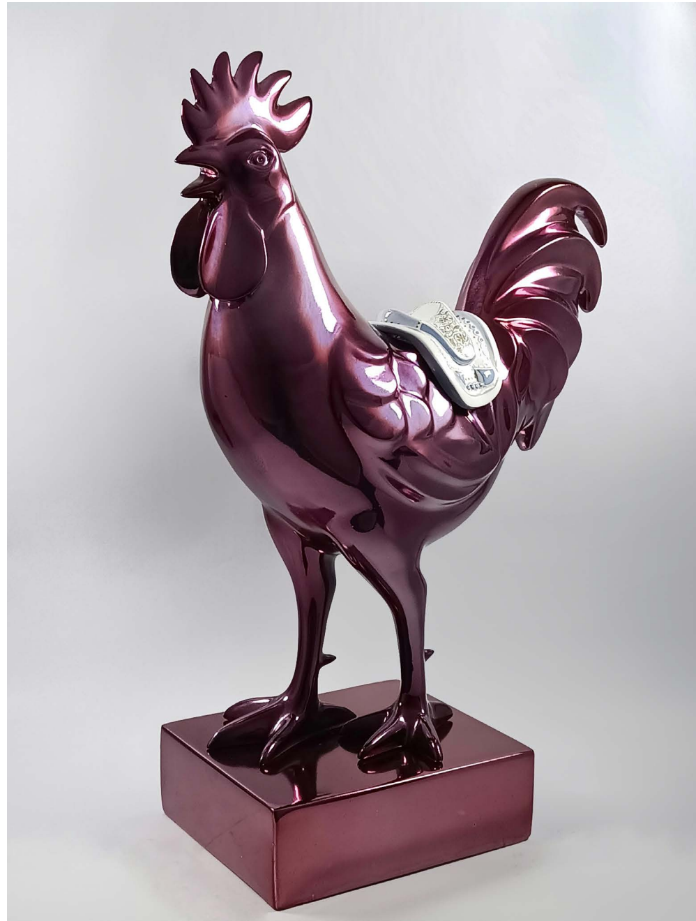
Fiberglass 36 × 16 × 52 cm Ed 1/3 2024 130/000/000T