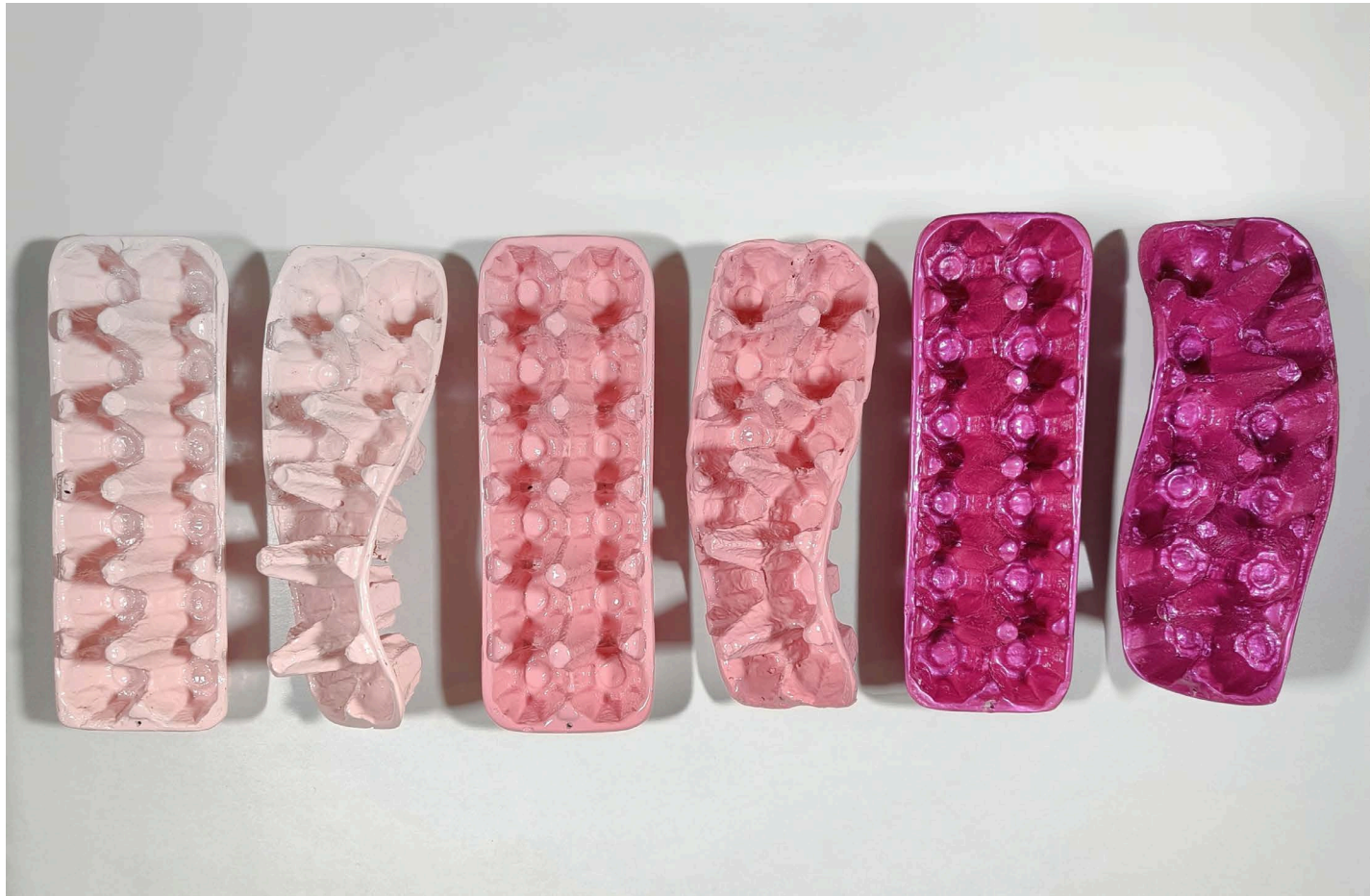
Fiberglass Each 11 × 30 × 8 cm 2024 30/000/000T