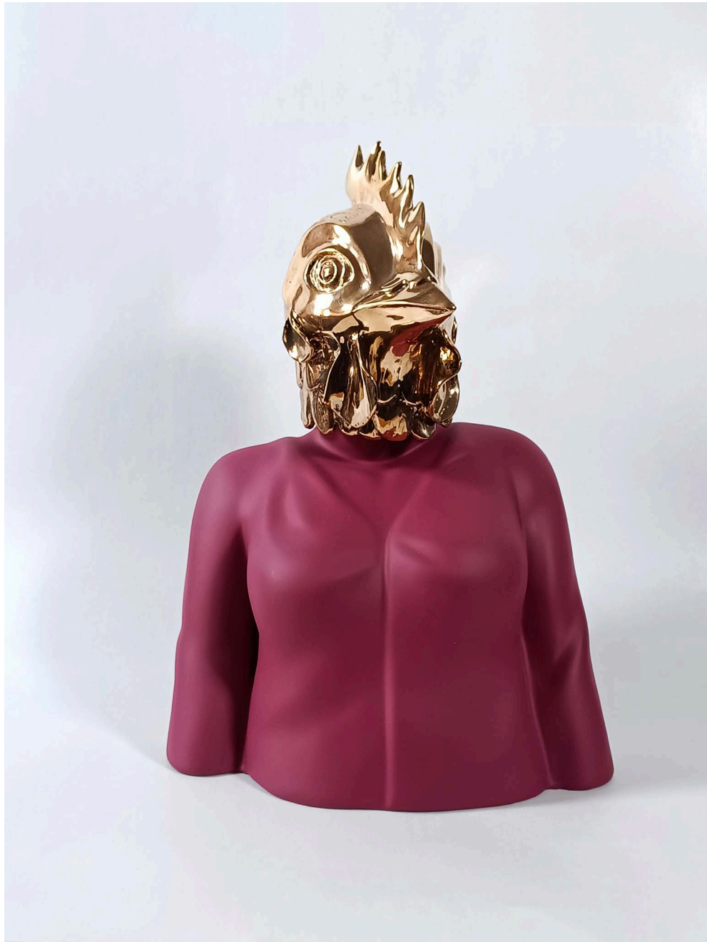
Fiberglass & bronze 25 × 15 × 39 cm Ed 1/3 2024 100/000/000T