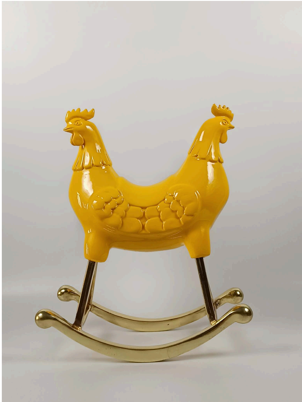
Fiberglass & bronze 25 × 13 × 30 cm Ed 1/3 2024 80/000/000T