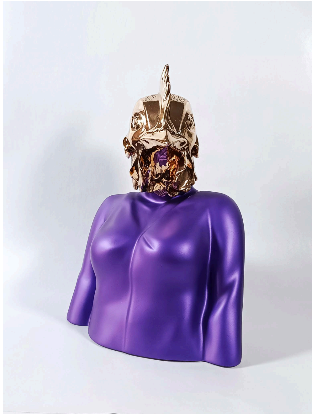
Fiberglass & bronze 25 × 15 × 39 cm Ed 1/3 2024 100/000/000T