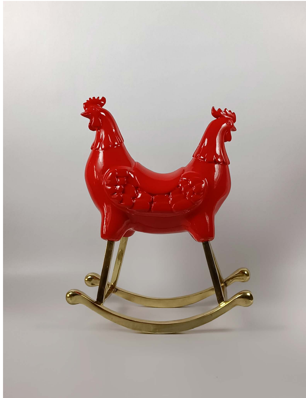
Fiberglass & bronze 25 × 13 × 30 cm Ed 1/3 2024 80/000/000T