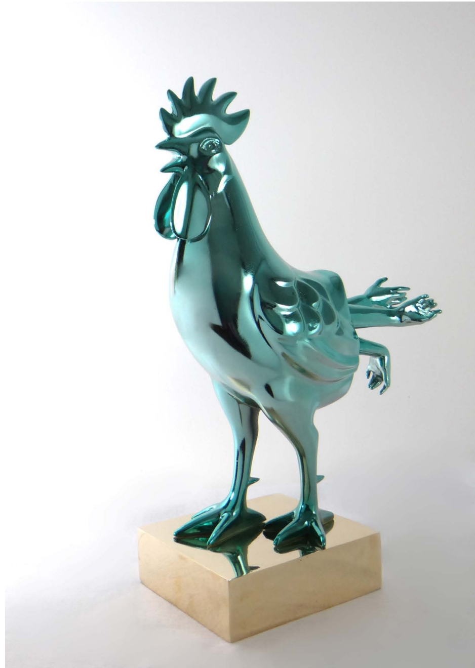
Fiberglass & bronze 56 × 16 × 33 cm Ed 2/3 2024 130/000/000T