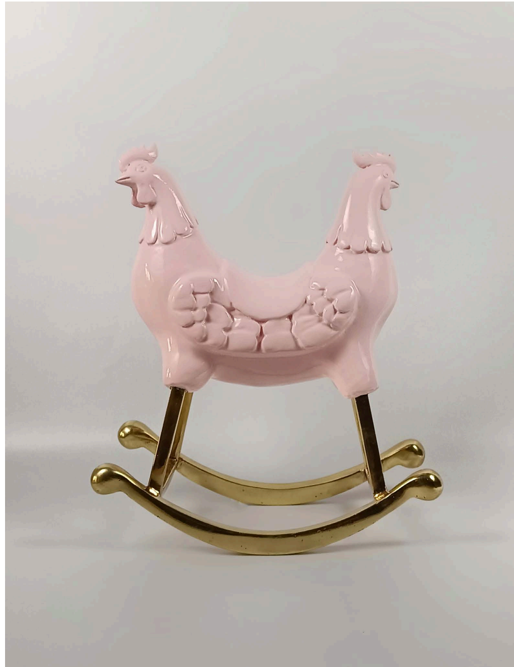
Fiberglass & bronze 25 × 13 × 30 cm Ed 1/3 2024 80/000/000T