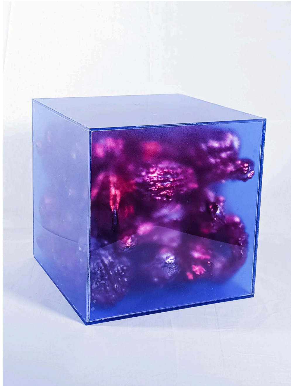
Fiberglass & Plexiglass 25 × 25 × 25 cm Ed 1/3 2024 60/000/000T