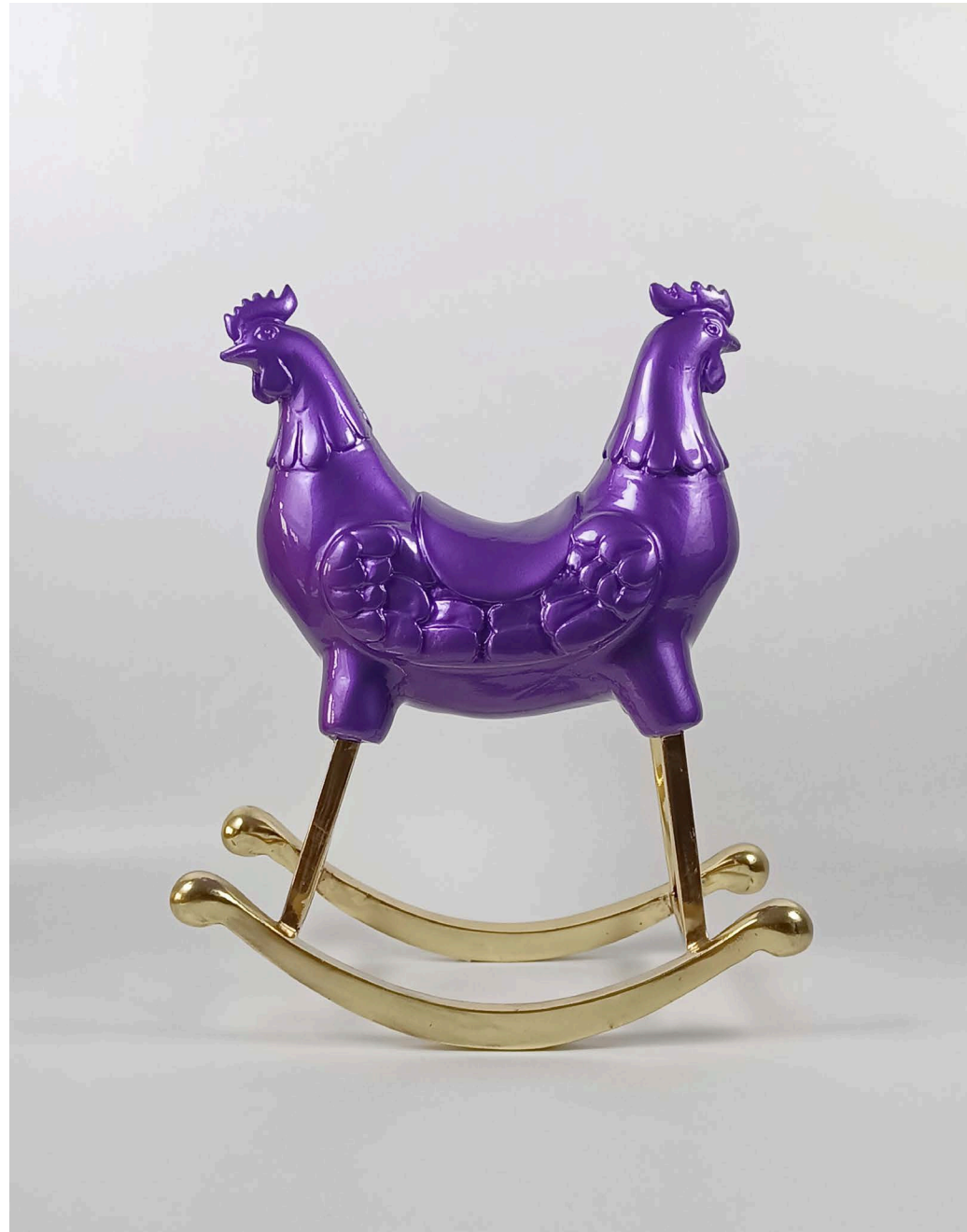
Fiberglass & bronze 25 × 13 × 30 cm Ed 1/3 2024 80/000/000T