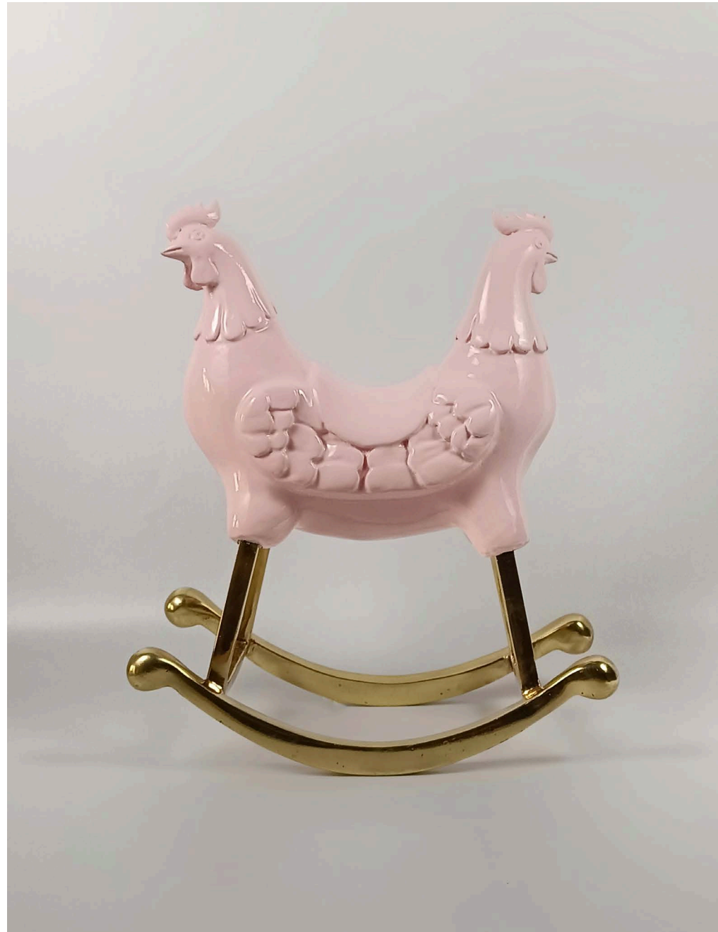
Fiberglass & bronze 25 × 13 × 30 cm Ed 1/3 2024