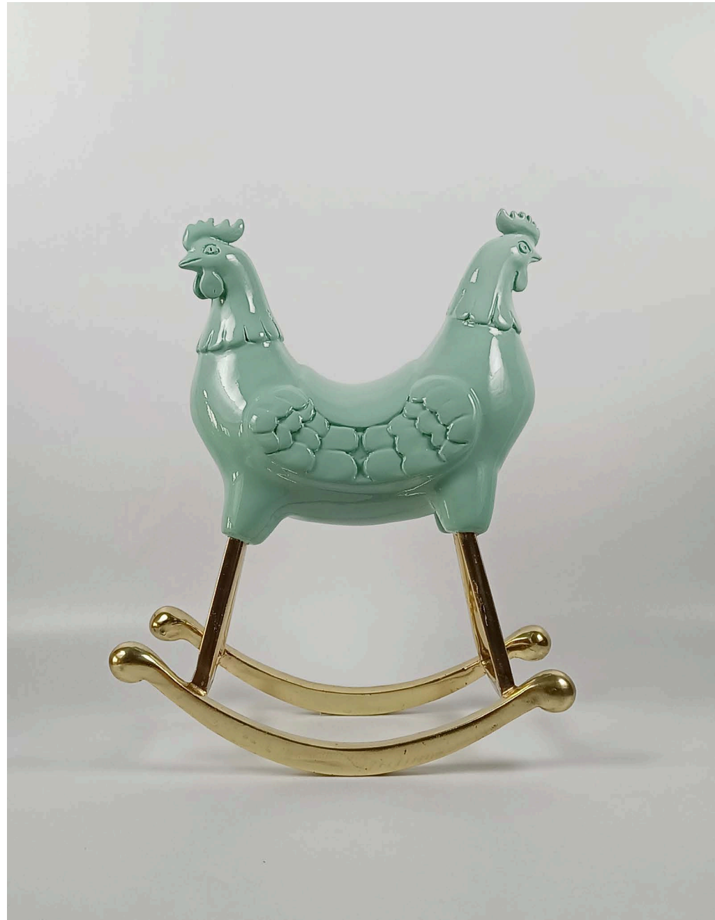
Fiberglass & bronze 25 × 13 × 30 cm Ed 1/3 2024