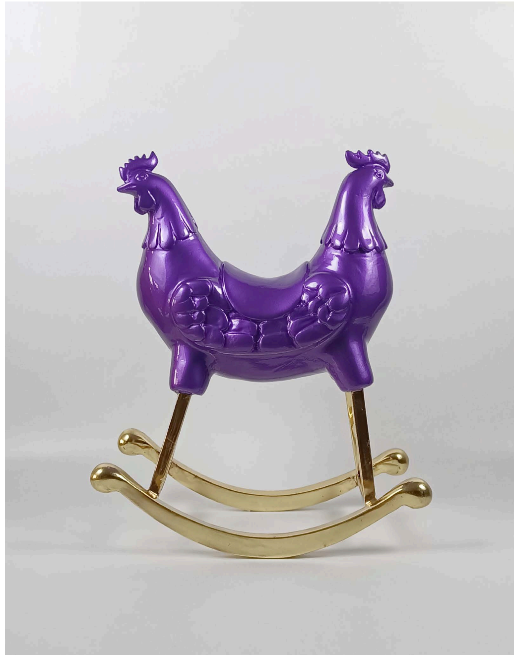
Fiberglass & bronze 25 × 13 × 30 cm Ed 1/3 2024