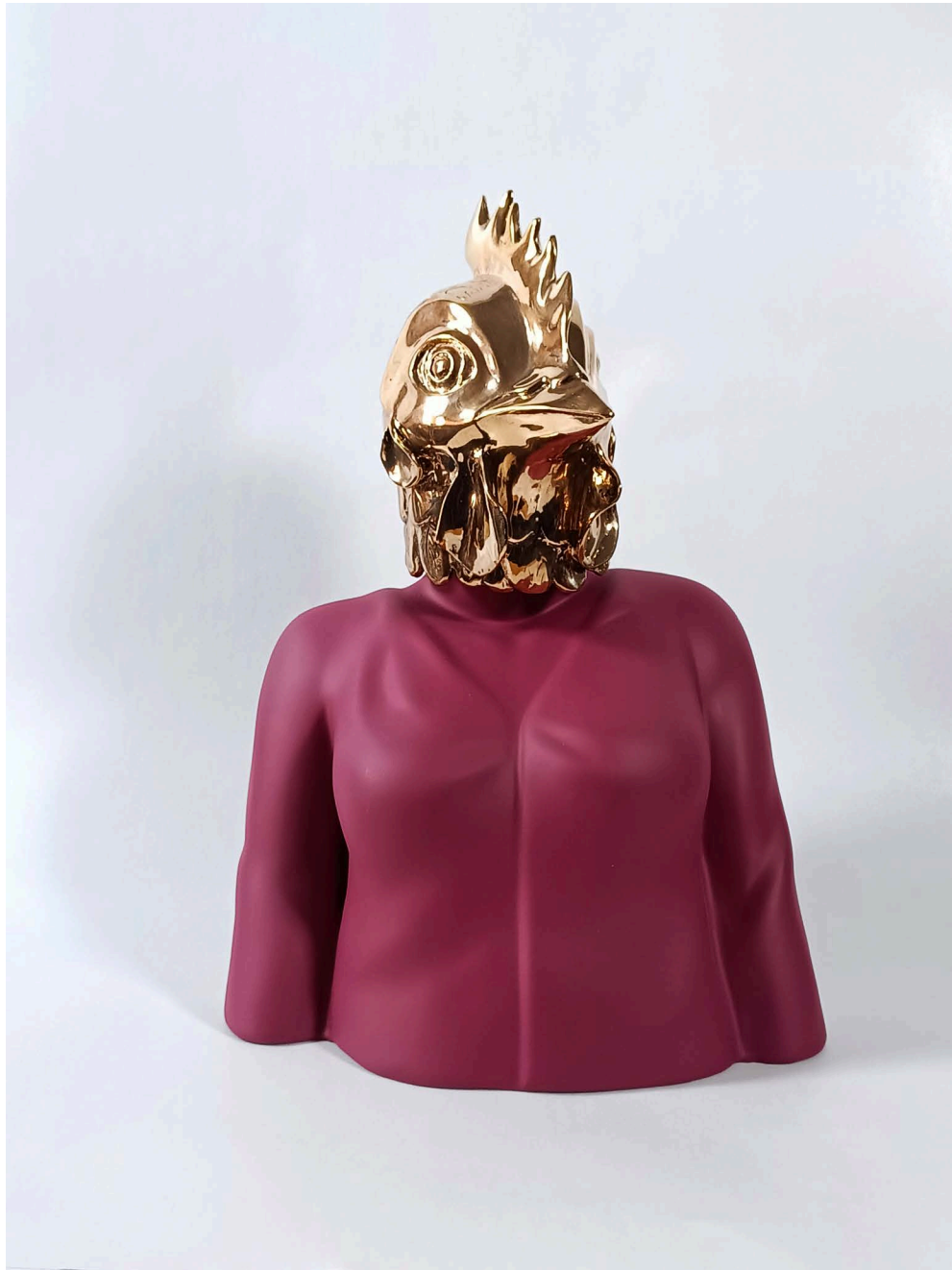
Fiberglass & bronze 25 × 15 × 39 cm Ed 1/3 2024