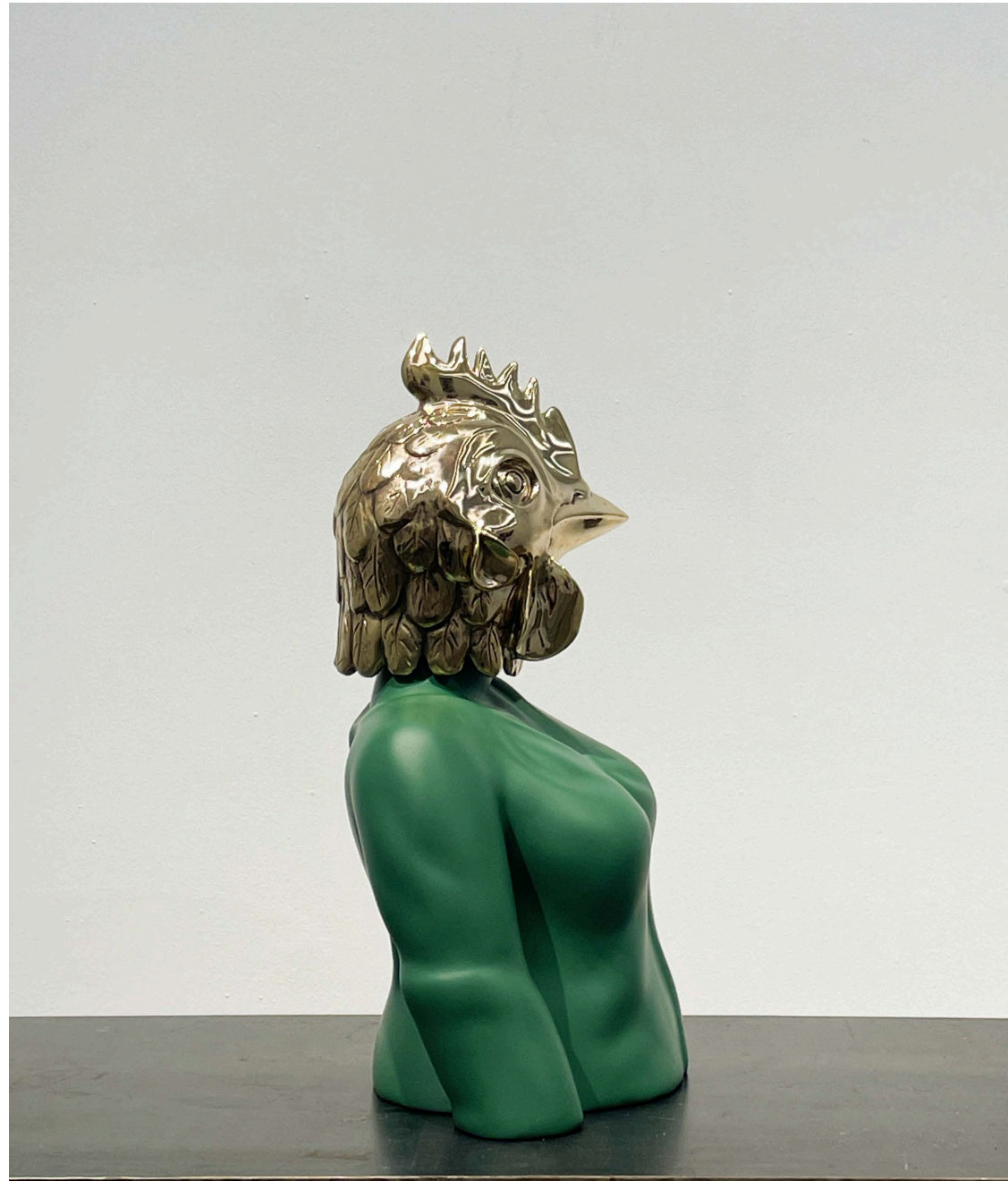
Fiberglass & bronze 25 × 15 × 39 cm Ed 1/3 2024