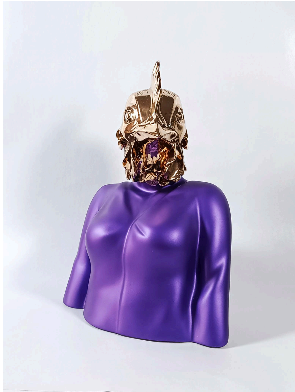
Fiberglass & bronze 25 × 15 × 39 cm Ed 1/3 2024