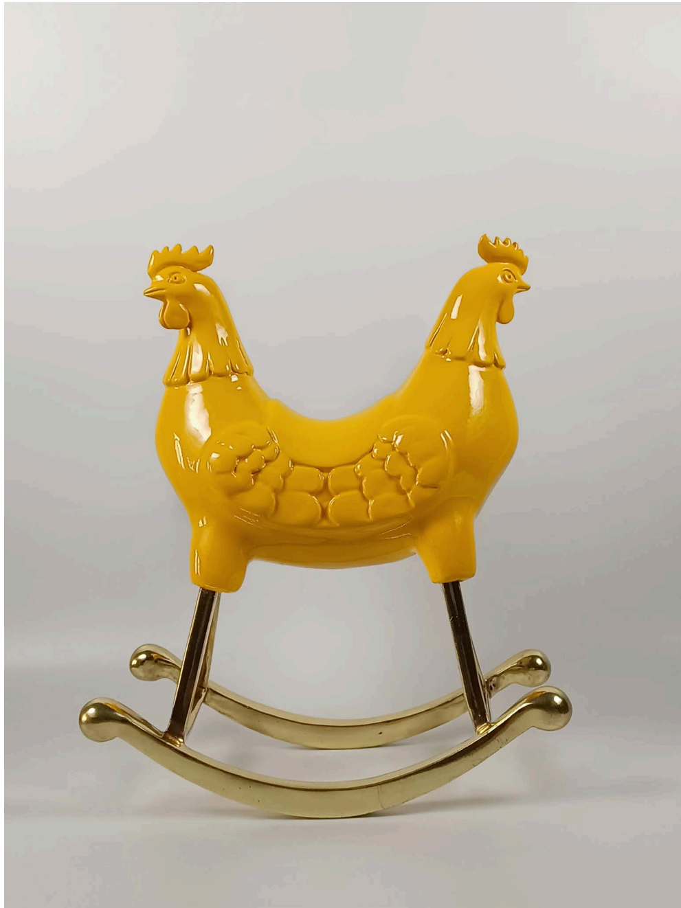
Fiberglass & bronze 25 × 13 × 30 cm Ed 1/3 2024