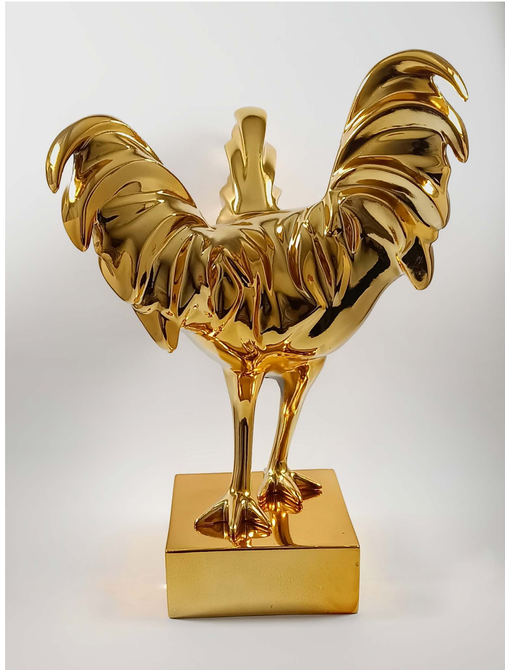
Fiberglass 38 × 38 × 33 cm Ed 1/3 2024