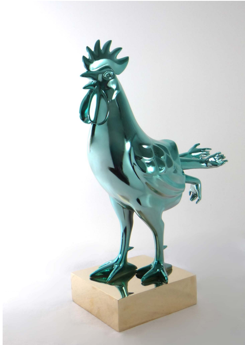
Fiberglass & bronze 56 × 16 × 33 cm Ed 2/3 2024