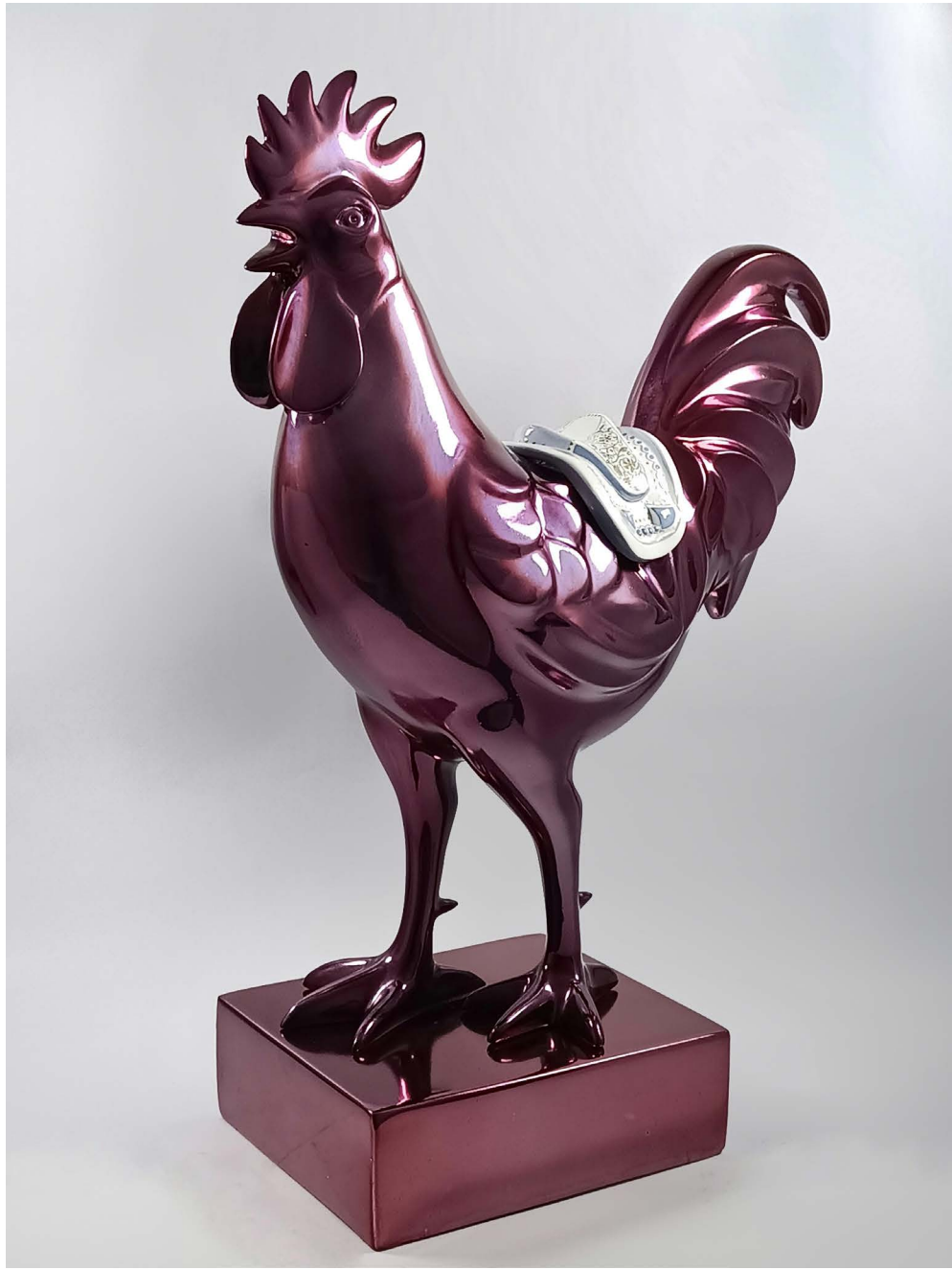
Fiberglass 36 × 16 × 52 cm Ed 1/3 2024