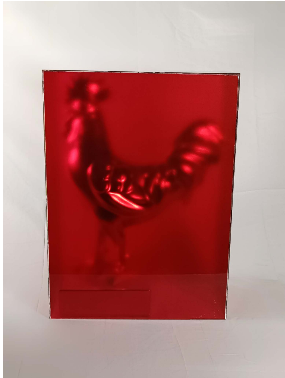
Fiberglass & Plexiglass 52 × 38 × 19 cm Ed 1/3 2024