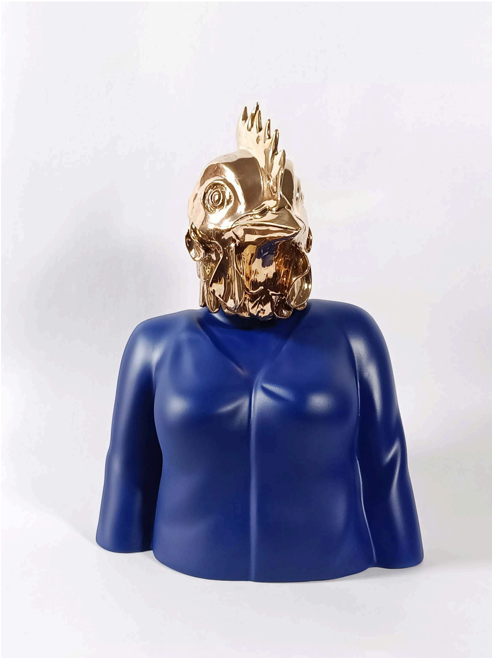
Fiberglass & bronze 25 × 15 × 39 cm Ed 3/5 2024