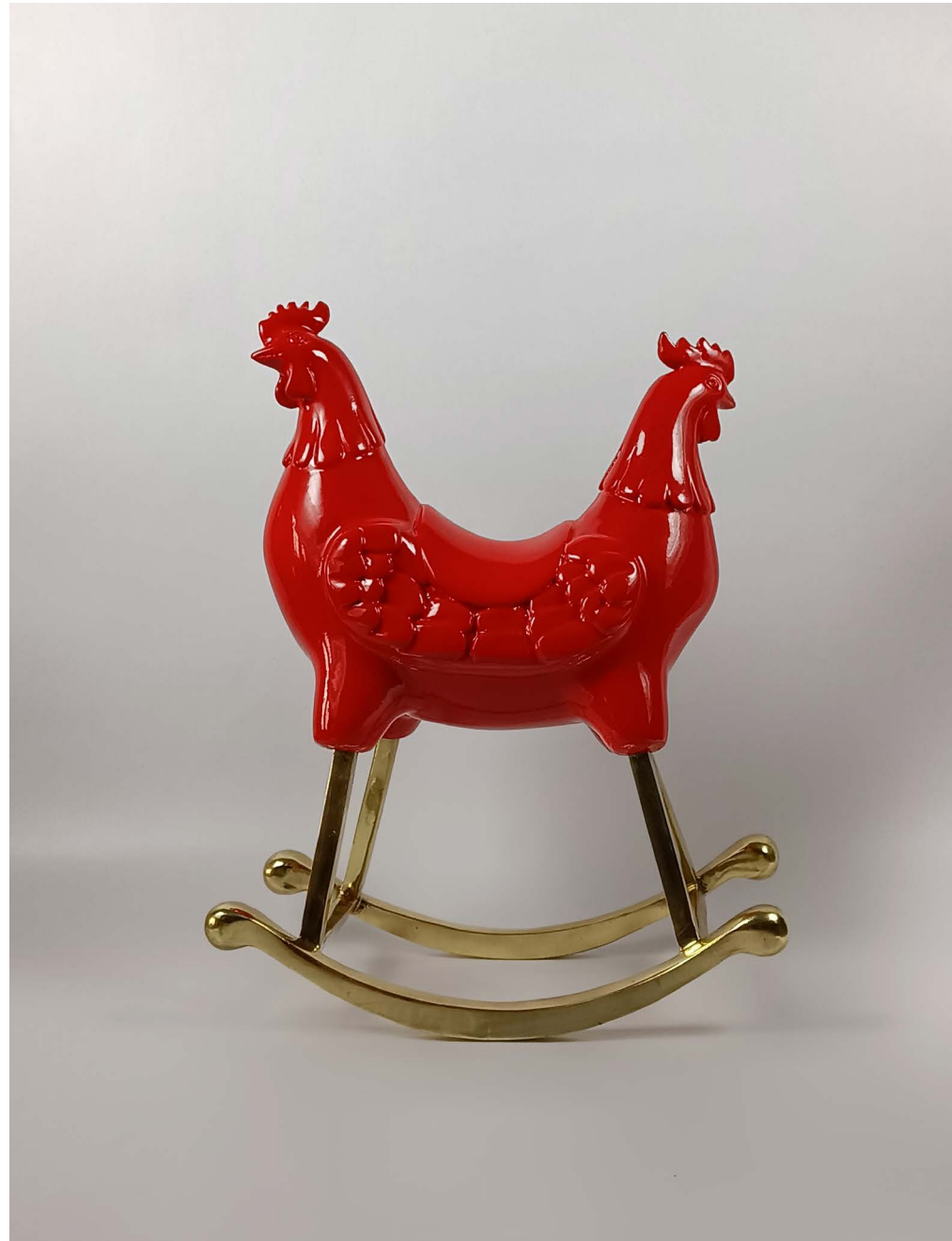
Fiberglass & bronze 25 × 13 × 30 cm Ed 1/3 2024